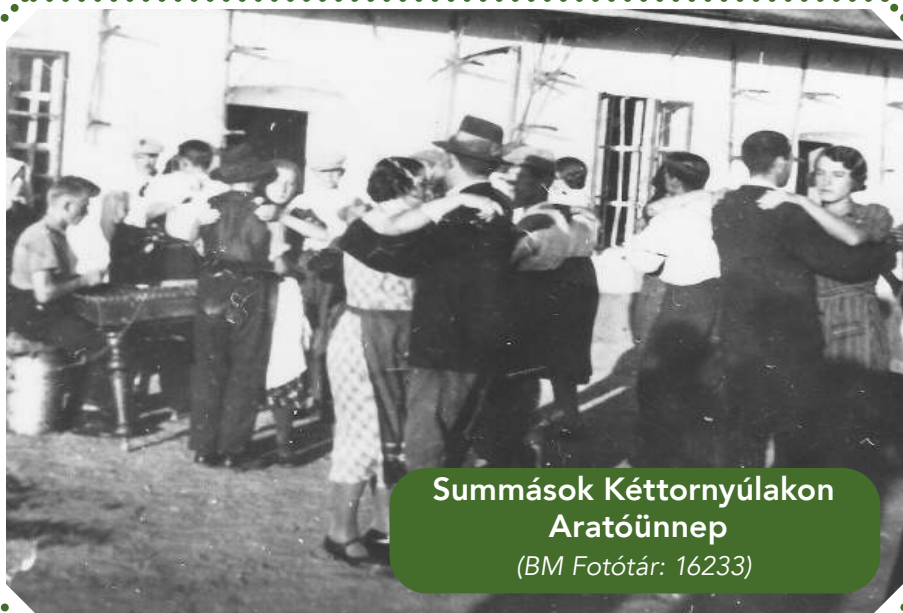
Summások Kéttornyúlakon Aratóünnep

Munka után és vasárnap, a mosás és tisztálkodás után pihentek néhány órában. A munkanapokat elválasztó estéken inkább csak énekszóval vagy történetekkel szórakoztatták egymást, míg a pihenőnapokon jött el az ideje a zenés táncos együttlétnek és a dalolásnak.