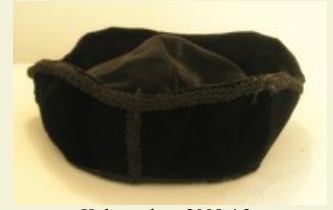
Kalap – ltsz. 2008.4.2.