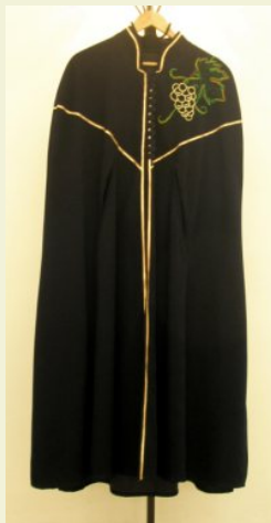
leltári száma: 2008.2.1.