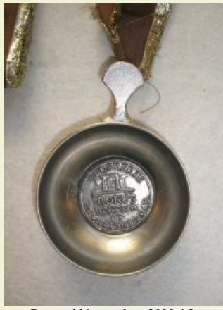
Borrend lánca - ltsz. 2008.4.3.