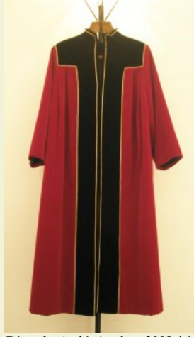
Díszruha (palást) – ltsz. 2008.4.1.