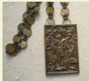
Érem láncon – Itsz. 2008.3.3.