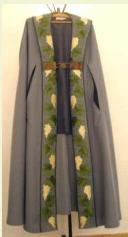
Díszruha (köpeny) – Itsz. 2008.3.1.