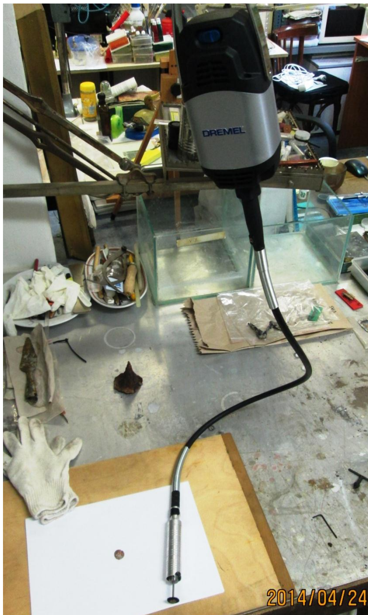
A beüzemelt DREMEL Fortifex 9100

A támogatott eszközbeszerzés a Balatoni Múzeum restaurátor műhelyének hiányos, előregedett technikai eszközcseréjének első lépése, mellyel a szakmai munka eredményességének szempontjából egy fontos, régóta esedékes célja valósult meg.