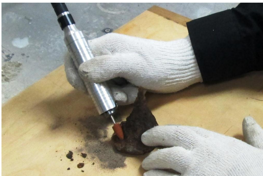
Vas pajzsdudor tisztítása